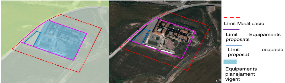
Imatge 2: Planejament vigent i proposta de Modificació. Font: Elaboració pròpia a partir de la documentació de la Modificació

Pel que fa a la qualitat i fragilitat paisatgística de l'àmbit, es valora favorablement que el DAE incorpora la informació establerta en el Catàleg de paisatge de les Comarques Centrals (CPCC, en endavant) aprovat definitivament en data 27 de juliol de 2016, el qual emmarca l'àmbit de l'actuació dins la unitat paisatgística 9 Costers de la Segarra. Segons el mapa de valors estètics del CPCC, l'àmbit es troba en un entorn agroforestal en la zona denominada Plans de Calaf. Cal destacar que el DAE recull les propostes de criteris i accions dirigides a la protecció, la gestió i l'ordenació que s'estableixen per a l'esmentada unitat i que li són d'aplicació a l'àmbit. Així mateix, es destaca l'anàlisi de la conca visual realitzada en el DAE on es valora l'exposició visual en un radi d'1,5 km de la proposta d'ampliació tant des dels principals recorreguts paisatgístics com des dels punts emblemàtics del terme. Segons es pot concloure, l'àmbit esdevé més visible des de la vessant sud-est de l'àrea visual projectada.