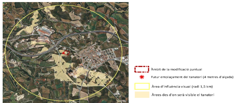
Imatge 3. Exposició visual de l'àmbit de la Modificació.

Pel que fa a la qualitat i fragilitat paisatgística de l'àmbit, es valora favorablement que el DAE incorpora la informació establerta en el Catàleg de paisatge de les Comarques Centrals (CPCC, en endavant) aprovat definitivament en data 27 de juliol de 2016, el qual emmarca l'àmbit de l'actuació dins la unitat paisatgística 9 Costers de la Segarra. Segons el mapa de valors estètics del CPCC, l'àmbit es troba en un entorn agroforestal en la zona denominada Plans de Calaf. Cal destacar que el DAE recull les propostes de criteris i accions dirigides a la protecció, la gestió i l'ordenació que s'estableixen per a l'esmentada unitat i que li són d'aplicació a l'àmbit. Així mateix, es destaca l'anàlisi de la conca visual realitzada en el DAE on es valora l'exposició visual en un radi d'1,5 km de la proposta d'ampliació tant des dels principals recorreguts paisatgístics com des dels punts emblemàtics del terme. Segons es pot concloure, l'àmbit esdevé més visible des de la vessant sud-est de l'àrea visual projectada.